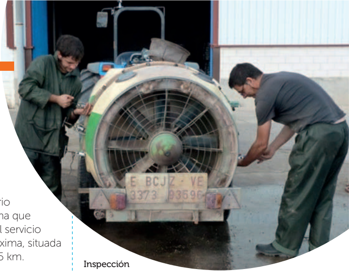
Inspección de un pulverizador hidroneumático (atomizador). Programa Piloto en el ATRIA de Épila.

Las entidades autorizadas realizarán charlas informativas previas y se anunciarán en las distintas localidades, facilitando un teléfono y/o correo electrónico de contacto para solicitar cita previa, con el objeto de poder organizar adecuadamente el proceso inspector.